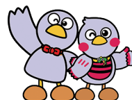
埼玉県のマスコット 「コバトン」「さいたまっち」

事前予約をした企業に対して、 社労士等相談員が個別相談の対応をします。(Zoom開催) ※1社あたり30分程度となります。